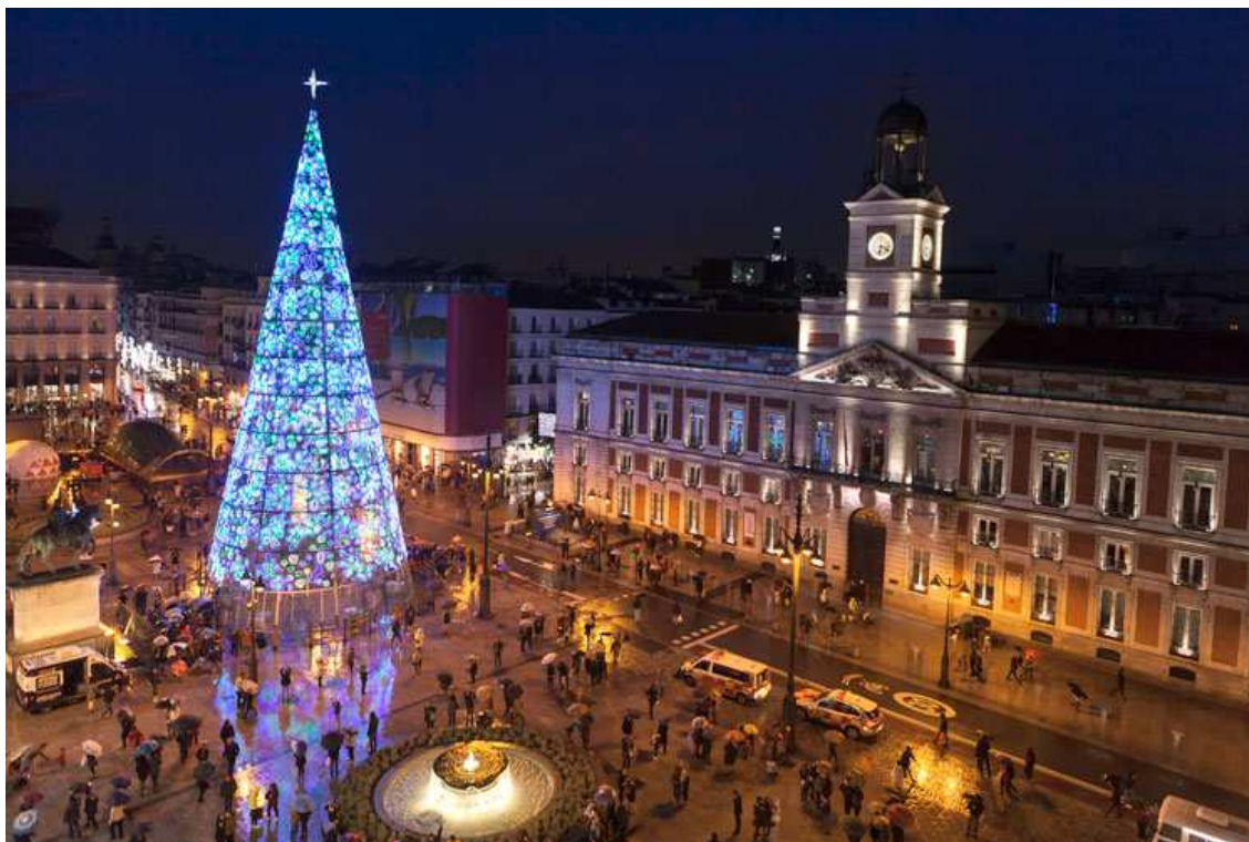
Navidad en Madrid – Puerta del Sol