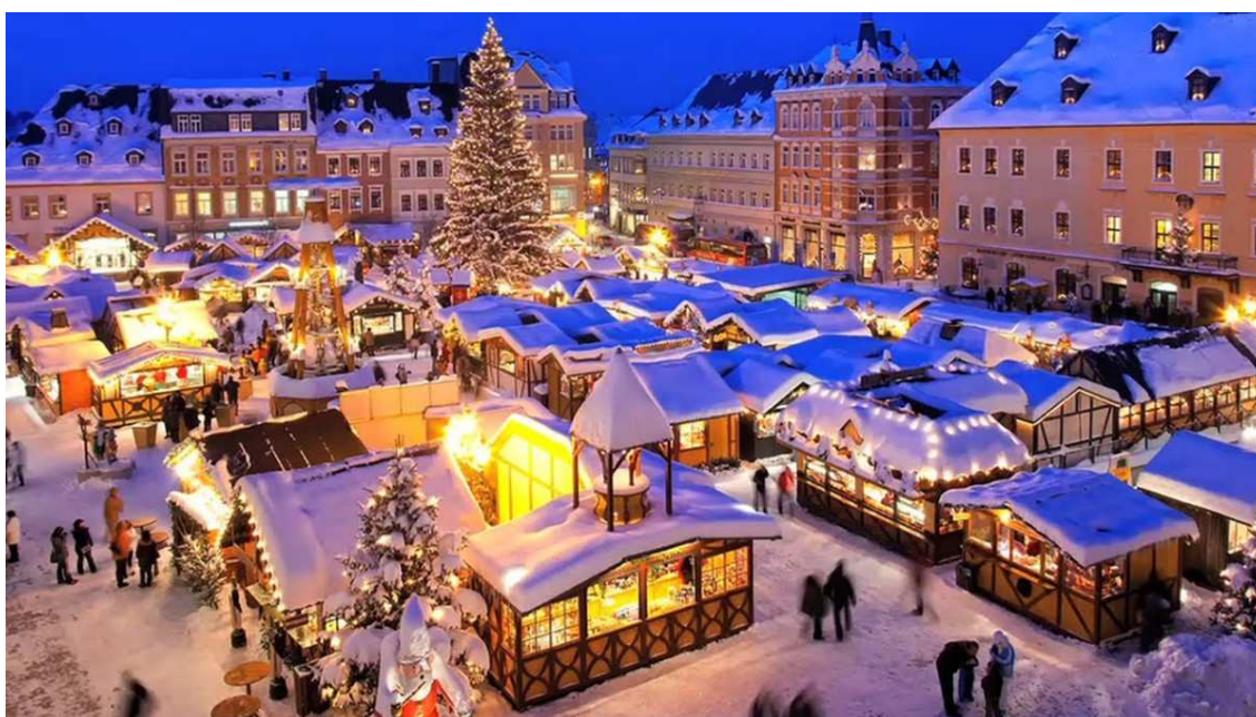
Navidad en Oslo